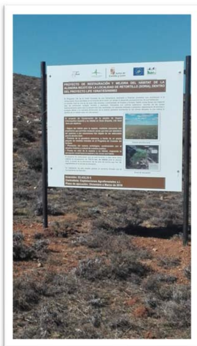
Fotografía 1. Restauración topográfica en Retortillo de Soria.

Actualmente han finalizado ya los trabajos correspondientes a la Restauración de hábitats C1 y Restauración Topográfica C2, quedando pendiente la realización de los trabajos correspondientes a la Restauración de zonas degradadas C4. En el primer trimestre de 2019 se instaló el último panel correspondiente a la acción C1 en el municipio de Retortillo de Soria.