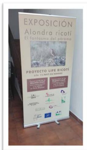
Centro social de Barahona

La estancia de la exposición en estos dos enclaves se ha hecho coincidir con las charlas de divulgación ambiental en el marco del proyecto Life ricotí que se llevaron a cabo por parte de la Diputación Provincial de Soria los días 12, 14, 19 y 20 de Agosto de 2019 en las localidades de Medinaceli, Retortillo, Barahona y Arenillas y que están reseñadas en este documento dentro de las acciones E4.