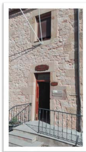
Centro social de Retortillo de Soria